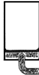
2. Ballastwasser pumpen