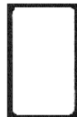
5. völlig beschichtete Oberfläche